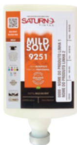
Clean Pack - 500 ml